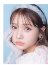
流那 (ばんばんざい)