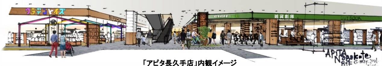
「アピタ長久手店」内観イメージ