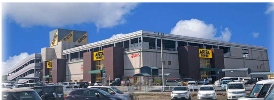
「APITAパワー大府店」外観