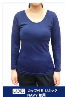
LADIES カップ付き Uネック NAVY 着用