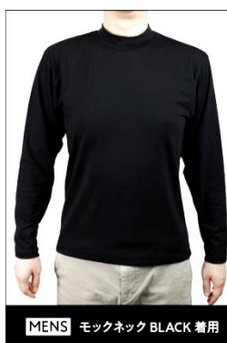
MENS モックネック BLACK 着用