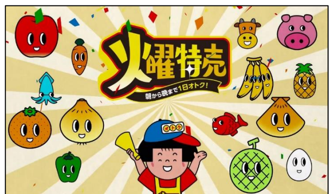
14年ぶりに復活した「おトクちゃん」

また、チラシ・LINE・ユニーHP※にも登場し、ニューファミリー層への認知を強化するとともに、「昭和・平成レトロ」がブームのZ世代にも、ノスタルジックな雰囲気を持つ「おトクちゃん」に興味をもってもらうことで、次世代消費者のアピタ・ピアゴファン拡大を狙います。