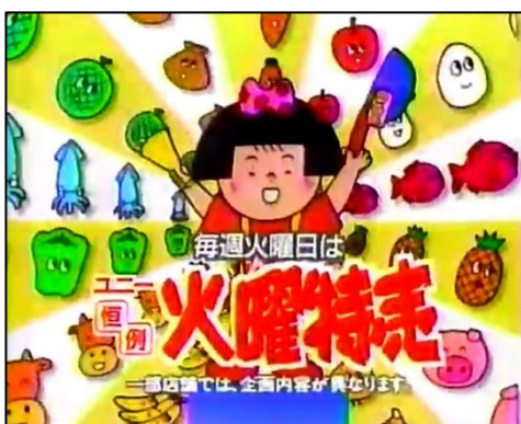
当時のテレビCMイメージ

1993～2008年まで愛知・三重・岐阜のテレビCMやラジオCMで16年間流れ、東海エリアの40代以上のお客さまの記憶に残り続けるとともに、20～30代にとっては子どものころに見た覚えがあるキャラクター「おトクちゃん」を復活させ、ポスター・POP・動画などの店内販促物でにぎやかにアピタ・ピアゴの“オトク”をお知らせします。