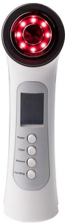
Moisture(うるおい)モード使用時

情報価格 RF 美顔器 BEAUTY INSIDE (店舗上限価格 税抜 5,980 円/税込 6,578 円) ※USB 充電式