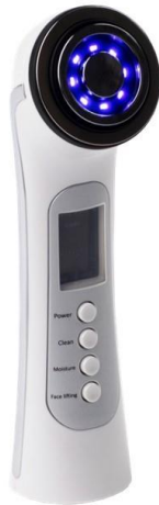
Clean(クリーン)モード使用時