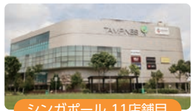
シンガポール 11店舗目