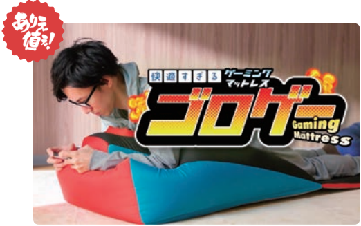
イエナカ需要とeスポーツ人気の拡大から、ドン・キホーテではゲーミングアイテムを続々開発中!

「ゲームが好きだけど、ゲーミングチェアはいらない」「むしろ長時間横になっていたらゲームを楽しみたい」という“床ゲーマー”に最適なウレタンとビーズクッションの「ゲーミングマットレス」を開発。ゲーム好きの開発担当者がこだわり抜き、どんな姿勢でも快適にゲームができるよう設計されています。