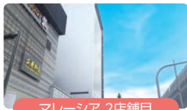
マレーシア 2店舗目