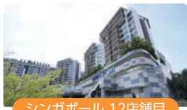
シンガポール 12店舗目