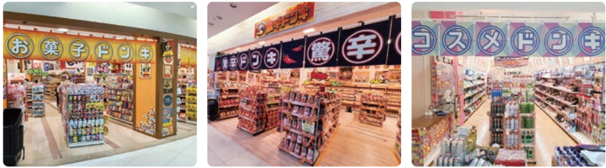
2021年11月、千葉県柏市の「モラージュ柏」に同時オープンした「お菓子ドンキ」「驚辛ドンキ」「コスメドンキ」。

美容商品に特化した「コスメドンキ」、輸入品など珍しいお菓子を集めた「お菓子ドンキ」、激辛商品だけの「驚辛ドンキ」など、カテゴリー特化型店舗の展開が進んでいます。2021年5月、東京駅直結の八重洲地下街にオープンした「お菓子ドンキ・お酒ドンキ」を皮切りに、11月に千葉県柏市、2022年1月に埼玉県所沢市の商業施設へと続々展開中です。