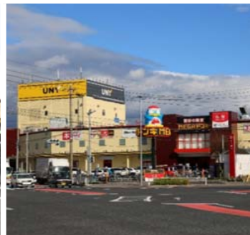
豊田元町店 Toyotamotomachi store