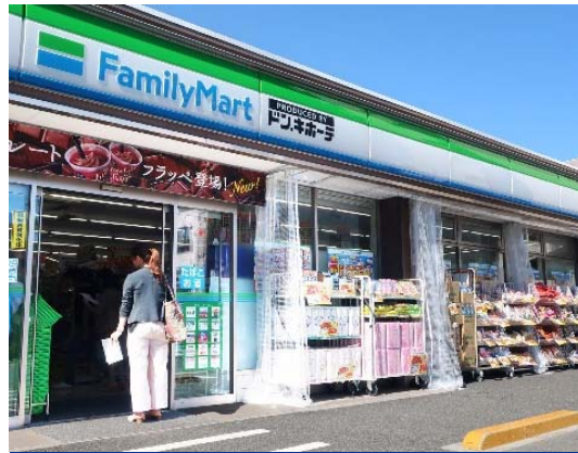
立川南通り店 Tachikawa minami dori store

Work with Family Mart — Next gen's convenience store