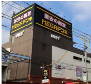
大口店 Oguchi store