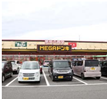
星川店 Hoshikawa store