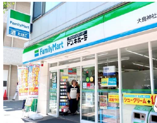
大鳥神社前店 Otori jinja store