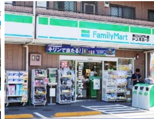
世田谷鎌田三丁目店 Setagaya kamata store