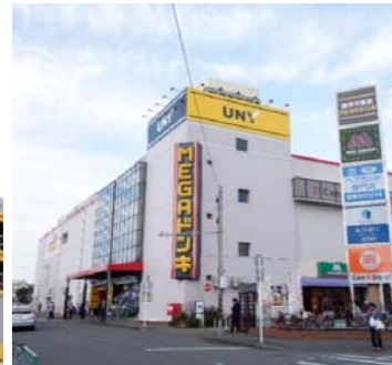
座間店 Zama store