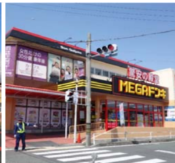
国府店 Kou store