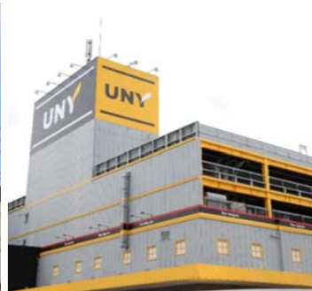
東海通店 Tokaidori store